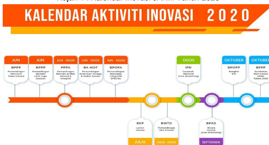
Rajah 1 : Kalendar Inovasi JANM Tahun 2020

Sebanyak 12 aktiviti inovasi telah dirancang untuk dilaksanakan sepanjang tahun 2020. Walau bagaimanapun, hanya sembilan (9) aktiviti yang dapat dilaksanakan. Tiga (3) aktiviti yang tidak dapat dijalankan adalah lawatan inovasi, ceramah motivasi dan Majlis Sambutan Hari Inovasi dan Integriti JANM. Sembilan (9) aktiviti inovasi JANM tersebut telah dilaksanakan dengan mengamalkan norma baharu serta mematuhi SOP yang telah ditetapkan.