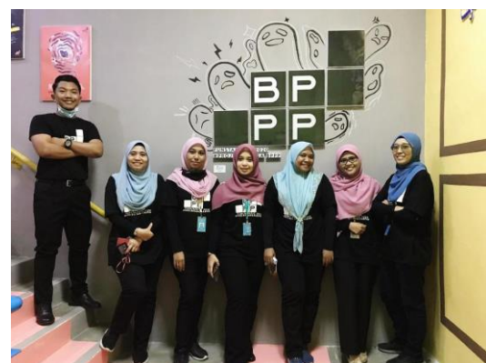
Antara Peserta Yang Terlibat Dalam Pertandingan Keceriaan Tangga