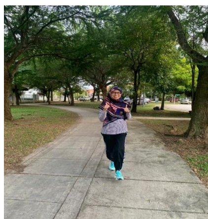
Antara Peserta Yang Terlibat Dalam Pertandingan Larian Inovasi