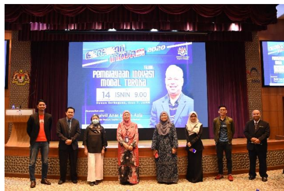
Antara Warga Yang Hadir Ke Ceramah Inovasi